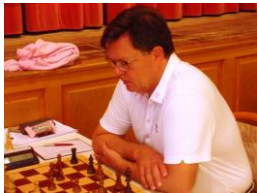
CM Krulich in Zeitnot 0:1