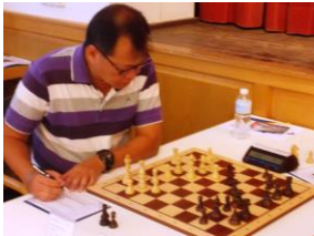
IM Chan 1:0