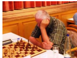
FM Schumacher 0:1