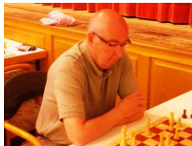
FM Rahls 1:0